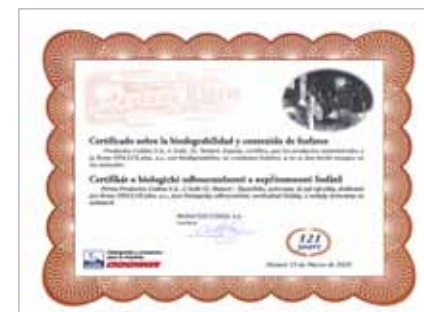
Certifikát o biologické odbouratelnosti a nepřítomnosti fosfátů