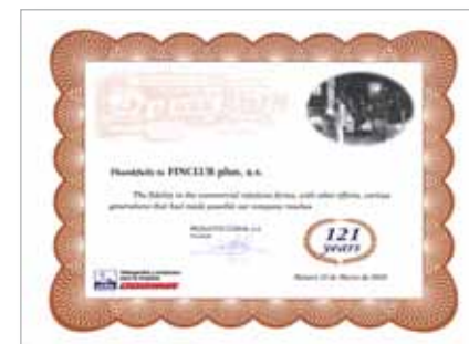
Poděkování za vzájemnou spolupráci a dosažené výsledky