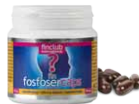
fin FOSFOSERCAPS doplňěk stravy

Balení: 60 kapslí. Doporučené dávkování: 2 kapsle 1-2x denně (prvních 10 dní 2 kapsle ráno, 2 kapsle v poledne, s jídlem a zapít, poté lze snížit na 2 kapsle denně, kdykoli). Ve 2 kapslích je: lyofilizovaný extrakt z novozélandských slávek ( Perna canaliculus ) 800 mg. Obal kapsle rostlinného původu s chlorofyly. Není určen dětem do 3 let.