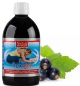
fin FLEXIGEL doplňěk stravy se sladidlem