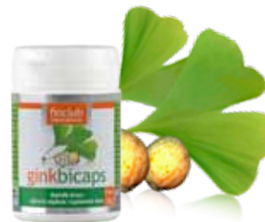
fin GINKBICAPS doplňěk stravy (vhodný i pro vegany)