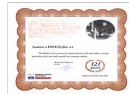
Poděkování za vzájemnou spolupráci a dosažené výsledky