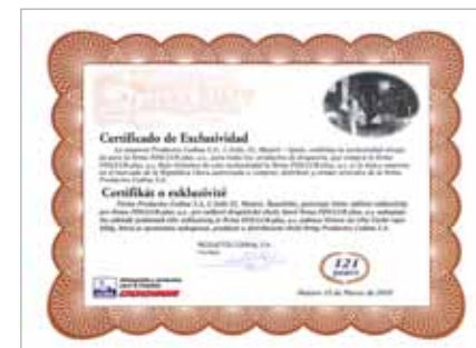
Certifikát potvrzující exkluzivitu pro firmu Finclub

Z uvedeného je patrné, že ekologičnost čisticích výrobků je pro výrobce naprostou prioritou a že jde značně nad rámec současných předpisů.