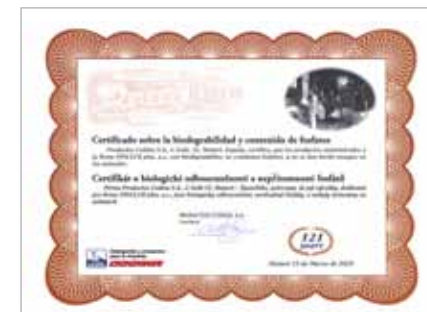
Certifikát o biologické odbouratelnosti a nepřítomnosti fosfátů